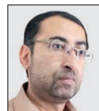
هادی اعلی فریمان

انتخاباتی که روز یکشنبه در وزن و نوا برگزار شد نشانه امیدوارکننده ای برای آینده نداشت. در همان ابتدای امر بحث میزان مشارکت مردم در انتخابات از جمله موضوعات بحث برانگیز بود. اپوزیسیون دولت میزان مشارکت در انتخابات را حدود ۲۳ درصد و در طرف مقابل کمیسیون انتخابات دولت میزان مشارکت را ۴۶ درصد اعلام کرده است. این میزان مشارکت در وزن و نوا از سال ۱۹۴۰ به این طرف بی سابقه است. در واقع اولین بحرانی که اکنون وزن و نوا پس از انتخابات با آن مواجه شده، بحران انتخابات است. زیرا فضای رایج ایجاد می کند که دولت نمی تواند حرف زیادی برای گفتن داشته باشد بنابراین همین موضوع تبدیل به اولین گام به سمت ادامه در صفحه ۰۶ بحران خواهد بود. مساله دیگر این است که مشکلات ساختاری در وزن و نوا کمالات به قوت خود باقی است و تحول جدیدی را شاهد نبودیم.